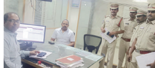
పోలీస్ సిబ్బందికి సూచనలు ఇస్తున్న జిల్లా ఎస్సీ రావుల గిరిధర్

అత్యుకారు నవంబరు 01 ప్రభాతవార్త : తెలంగాణ ప్రజల ఆరాధ్య దైవమైన కురుమూర్తి స్వామి బ్రహ్మాత్మ శివాల నందర్పుం అత్యుకారులోని ఎస్సీలు కార్యాలయం నుండి తరలింపు చేసను కురుమూర్తి స్వామి వారి ఆభరణాల తరలింపుకు పటిష్ట భద్రత చర్యలు చేపట్టింట్లుగా వనపర్తి జిల్లా ఎస్సీ రావుల గిరిధర్ వెల్లడించారు. శుక్రవారం సాయంత్రం అత్యుకారులోని పోలీస్ స్టేషన్కు అత్యుకారు తనిఖీ నిర్వహించిన అనంతరం ఈ నెల 6న అత్యుకారులోని ఎస్సీలు కార్యాలయం నుండి తరలింపిన కురుమూర్తి స్వామి ఆభరణాల కోసం భద్రత కల్పించేందుకు ప్రత్యేక బందగాలను ఏర్పాట్లు చేసినట్లుగా విలేజరులకు తెలిపారు. ఈ సందర్భంగా పోలీస్ స్టేషన్లో పలు ఫైర్లను తనిఖీ నిర్వహించి ఆయన సంతోషి వ్యక్తం చేశారు. స్వామి వారి ఆభరణాల తరలింపు కోసం ముందస్తుగానే పట్టణంలోని ప్రధాన వీధులలో 144 సెక్యూర్టీ పోలీసులు పాటించు భద్రత చేపట్టేందుకు ఎమ్మెల్యేకోవాలని అత్యుకారు సీపి జివన్ మూర్తి ఎస్సీ సరెందర్ లను ఎస్సీ అడివిలారు ఈ కార్యక్రమంలో అమరవిత మదనాపూర్ మండలం ఎస్సీలు పోలీస్ సిబ్బంది తదితరులు పాల్గొన్నారు.