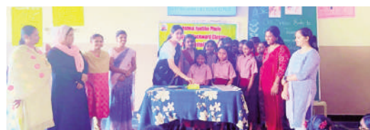
పాఠశాల ఆవరణలో కేక్ కట్ చేస్తున్న ఉపాధ్యాయులు

అచ్చంపేట, నవంబరు 01 ప్రభాతవార్త: ప్రభుత్వ గురుకుల పాఠశాలల్లో విద్యనభ్యసించే బడుగు, బలహీన వర్గాల విద్యార్థులకు నాణ్యమైన భోజనాన్ని అందించేందుకు రాష్ట్ర ప్రభుత్వం గతంలో అందించే మెన్ చార్జీల కంటే ప్రస్తుతం మెన్ చార్జీలను పెంచి ఉత్తర్వులను జారీ చేయడంతో అచ్చంపేట నియోజకవర్గం వెల్లూరు మహాత్మాజ్యోతిరావుపూలే బాలికల గురుకుల పాఠశాలలో విద్యార్థి సులత కలిసి పాఠశాల ప్రాధికార యామిని, ఉపాధ్యాయ బృందం వారందరూ మెన్ చార్జీల కంటే ప్రస్తుతం మెన్ చార్జీలను పెంచి ఉత్తర్వులను జారీ చేయడంతో మహాత్మాగాంధీ జ్యోతి బహుశా ప్రభుత్వ జూనియర్ గురుకుల కళాశాల ప్రాధికార బి.దమయంతి, ఉపాధ్యాయ బృందం, విద్యార్థులను హర్షం వ్యక్తం చేశారు. ఈ సందర్భంగా కళాశాల ఆవరణలో విద్యార్థులనులలో కలిసి ప్రాధికార బి.దమయంతి కళాశాల విద్యార్థులను నిర్వహించుకొని సీఎం రేవంకారెడ్డి, ఉప ముఖ్యమంత్రి మల్ల భట్టి విక్రమారాజ్, బీసీ గురుకుల సర్వేక్షణ శాఖ మంత్రి కృతజ్ఞులు తెలిపారు. ఈ సందర్భంగా ప్రాధికార బి.దమయంతి మాట్లాడుతూ గతంలో విద్యార్థులను అందరే మెన్ చార్జీలను 40శాతం పెంచి విద్యార్థులకు నాణ్యమైన భోజనాన్ని అందించేందుకు రాష్ట్ర ప్రభుత్వం దోహద పడుతుంది