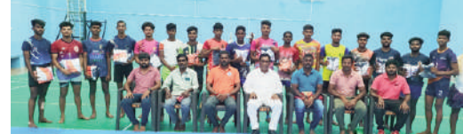
కబడ్డీ జట్టుకు ట్రాన్ సూట్స్ అందజేస్తున్న ఉపాధ్యాయులు