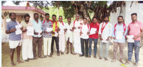
కరపత్రం విడుదల చేస్తున్న సిపిఎం పార్టీ నాయకులు