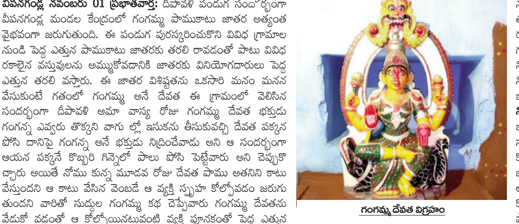
గంగమ్మ దేవత విగ్రహం

వీవనగండ్ల నవంబరు 01 ప్రభాతవార్త: దీపావళి పండుగ సందర్భంగా వీవనగండ్ల మండల కేంద్రంలో గంగమ్మ పాముకాటు జాతర అత్యంత వైభవంగా జరుగుతుంది. ఈ పండుగ పురస్కరించుకొని వివిధ గ్రామాల నుండి పెద్ద ఎత్తున పాముకాటు జాతరకు తరలి రావడంతో పాటు వివిధ రకాలైన వస్తువులను అమ్ముకోవడానికి జాతరకు వినియోగదారులు పెద్ద ఎత్తున తరలి వస్తారు.