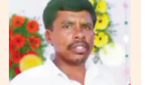
మృతి చెందిన రాజ్యాంధ్ర మాల్యానాయక్ (ఫైల్)