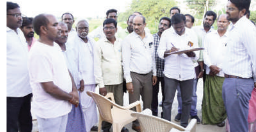
ఎన్యూమరేటర్ బ్లాక్ సర్వేను పరిశీలించు కలెక్టర్