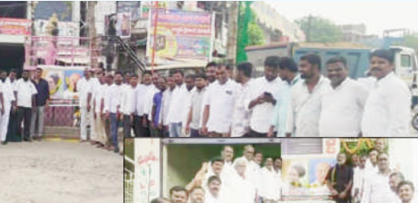
మండల కాంగ్రెస్ నాయకులు ఆధ్వర్యంలో నివాళులు అర్పించారు

మహనీయుల స్ఫూర్తితో రాష్ట్రంలో ప్రజాపాలన ఘనంగా ఇందిరాగాంధీ వర్ధంతి, సర్కార్ పట్టణాదు వరే జరుంఠి పెళ్ళిరు నవంబరు 01 ప్రభాతవార్త: పెళ్ళిరు పట్టణ కాంగ్రెస్ పార్టీ, మండల కాంగ్రెస్ పార్టీ ఆధ్వర్యంలో ఘనంగా ఇందిరాగాంధీ వర్ధంతి వేడుక, సర్కార్ పట్టణాదు వరే జరుంఠి వేడుకను మండల, పట్టణ కాంగ్రెస్ పార్టీ కార్యాలయంలో ఘనంగా నిర్వహించడం జరిగింది. వారి చిత్రపట టానికి పూలపాలవేసి ఘనంగా నివాళులర్పించి దేశానికి వారు చేసిన సేవలను మరోసారి స్మరించు కుంటూ ఆశయ సాధనకు అనుకూలంగా ప్రతి కాంగ్రెస్ కార్యకర్త కృషి చేయాలని తెలిపారు. ఈ కార్యక్రమంలో పట్టణ కాంగ్రెస్ మండల కాంగ్రెస్ పార్టీ ఆధ్వర్యంలో కార్యకర్తల ఆధిక సంఖ్యలో పాల్గొని విజయవంతం చేశారు.